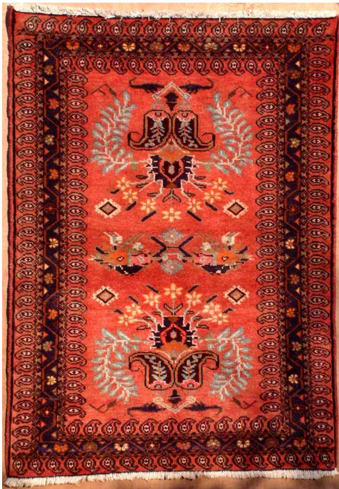
Malayer, afmeting 102 * 123 cm, wol op katoen, 8 knopen/cm 2