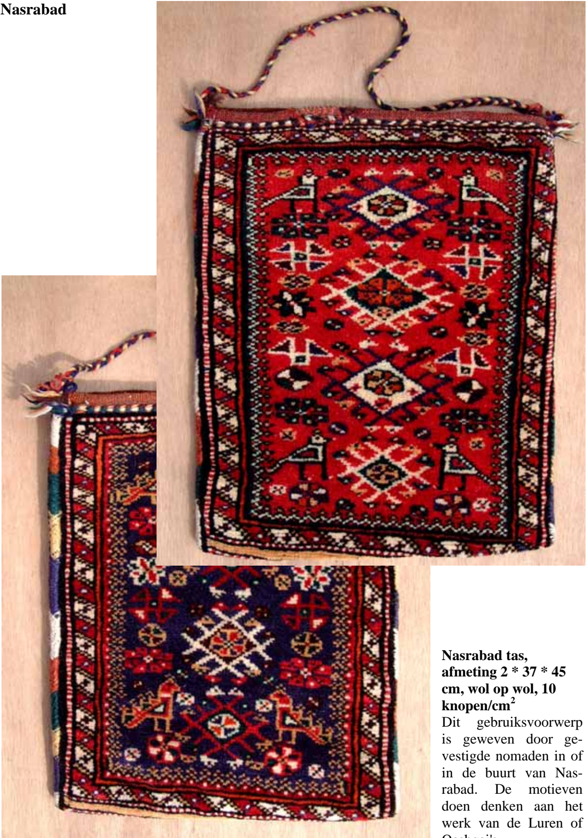
Nasrabad tas, afmeting 2 * 37 * 45 cm, wol op wol, 10 knopen/cm 2

Dit gebruiksvoorwerp is geweven door gevestigde nomaden in of in de buurt van Nasrabad. De motieven doen denken aan het werk van de Luren of Qashqai's.